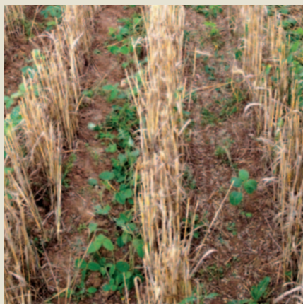
Culture de soja après moisson de blé