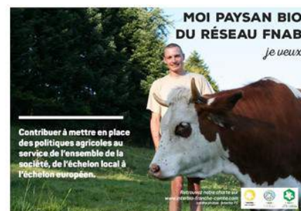
CARTES POSTALES - RÉSERVÉES AUX ADHÉRENTS