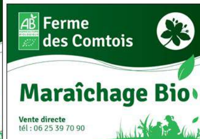
PANNEAUX - PERSONNALISÉS OU NON - 2 FORMATS