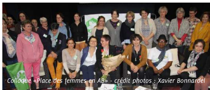
Colloque «Place des femmes en AB»

Adhérentes du réseau, transmettez vos photos à christelle.bobillier@agribiofranchecomte.fr avant le 1 er février. Un grand merci d'avance.