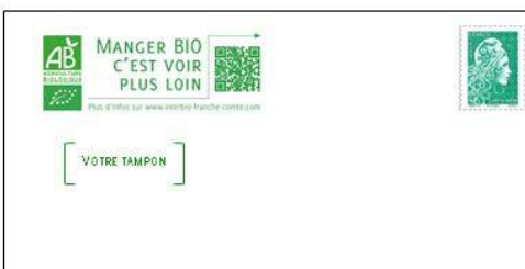
ENVELOPPES À EN-TÊTE